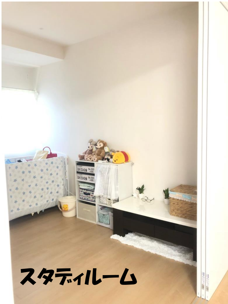
スタディールーム